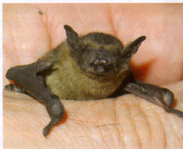
Zwergfledermausjungtiere sind eine Herausforderung für den erfahrenen Fledermausschützer.

Die Arbeitsgemeinschaft Fledermausschutz will uns seit 1994 das Leben der heimischen Fledermäuse näher bringen, die Lebensgewohnheiten der Fleder-